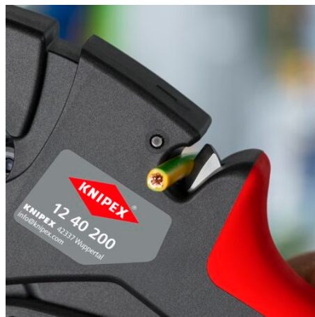
Integrierter Kabelschneider bis 10 mm 2 feindrätig, 6mm 2 eindrätig