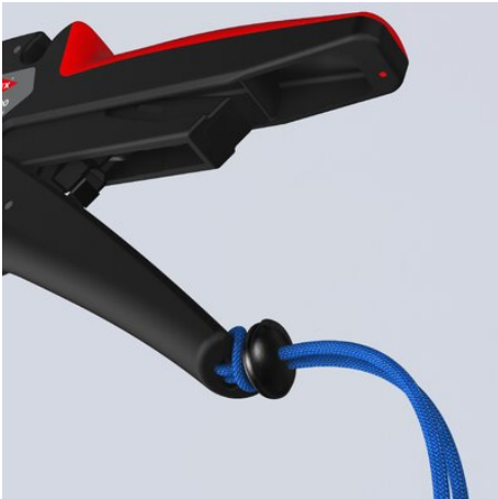
Befestigungsöse am Griffende (Absturzsicherung)